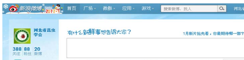
图 8 河北省昆虫学会的微博