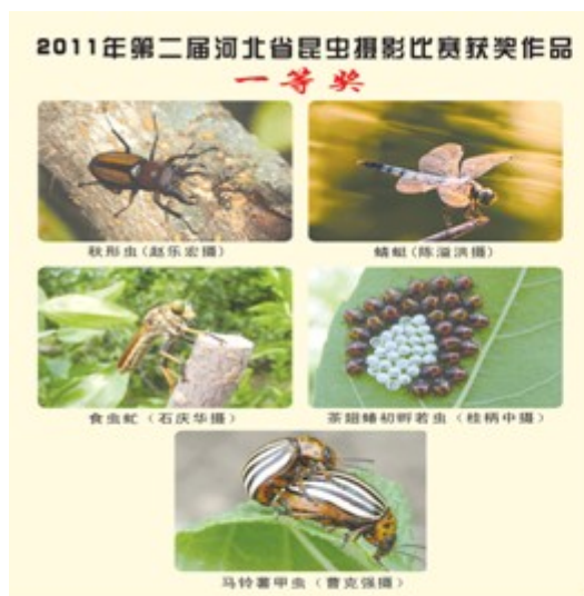
图 1 一等奖获奖作品

2011 年 12 月 27 日，由河北省昆虫学会举办的第二届河北省昆虫摄影比赛获奖作品及优秀作品展览在河北农业大学西校区第一餐饮楼广场举行，本次活动共展出展板 14 块（图 3），作品 100 余幅，还有部分昆虫标本和昆虫工艺品的展出。展览吸引了上万名师生和群众的观看（图 4，图 5），并受到一致好评。活动现场气氛活跃，工作人员积极与参观人员互动并解答疑问，观看人员被精彩的摄影作品和奇妙的昆虫世界所震撼，当场有 50 余名大学生主动申请加入昆虫学会(图 6)。