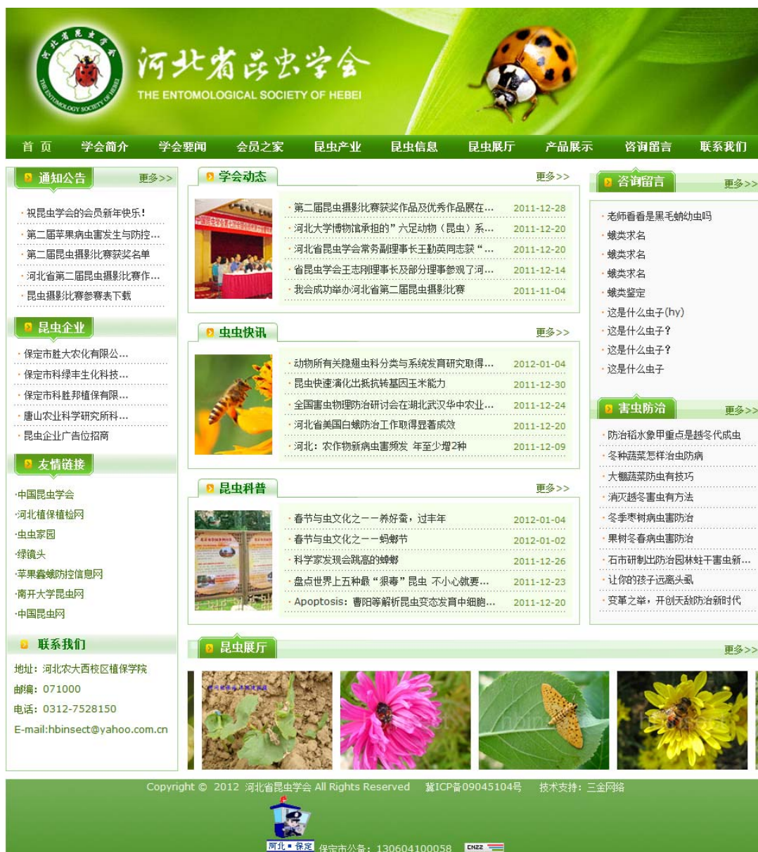
图 7 河北省昆虫学会网页

及河北省和其它 22 个省市，而且还涉及美国、日本、韩国、欧洲、香港特别行政区等地，浏览次数突破 1 万人次，达到了 12050 人次。新开通的河北省昆虫学会微博已被 388 人关注，现有粉丝 88 人。