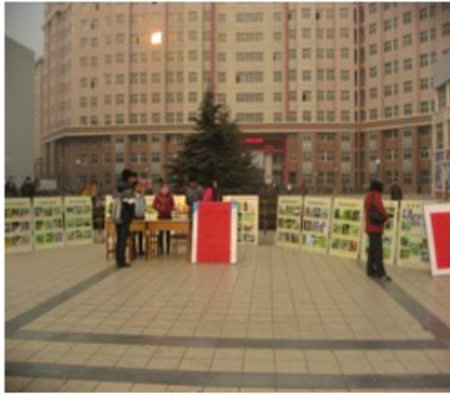
图 3 昆虫摄影作品展览