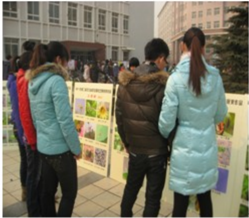
图 5 部分学生正在参观昆虫摄影