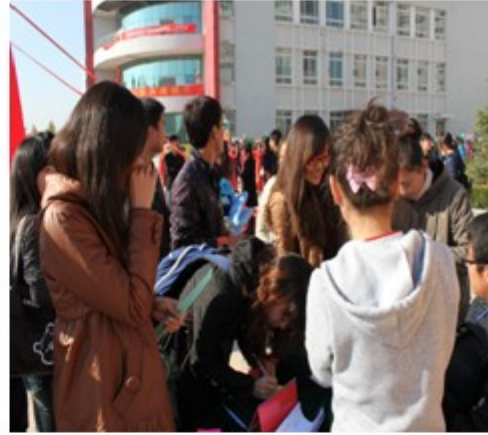
图 4 昆虫谜语有奖竞猜活动