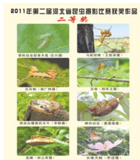
图 2 部分二等奖作品