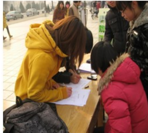
图 6 参观展览的大学生在填写入会申请表